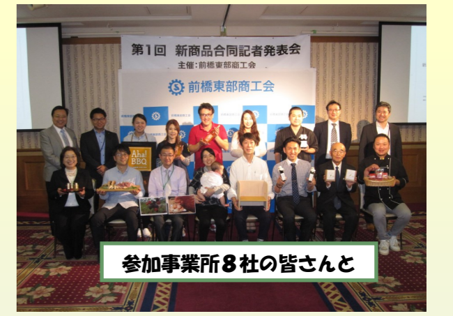
参加事業所8社の皆さんと