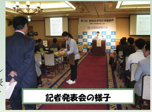
記者発表会の様子

令和に入って初めての群馬県民の日である10月28日(月)前橋テルサにて『第1回 新商品合同記者発表会』を開催しました。この発表会は、会員事業所の販路開拓を支援することが目的となっており、7月から9月の間に計4回のセミナーを実施しました。