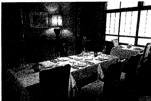
新規顧客獲得のための新設備・什器導入