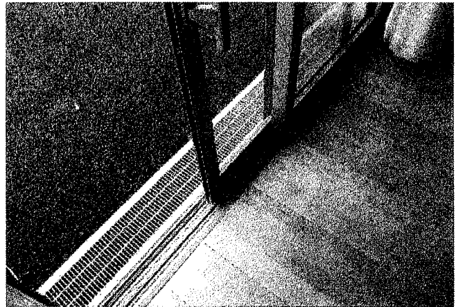
高齢者客に対応した店舗のバリアフリー化