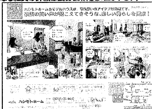
新たな取組みをPRするためのチラシ作成・配布